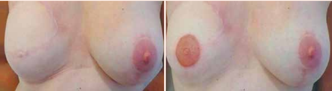
Vor der Pigmentierung