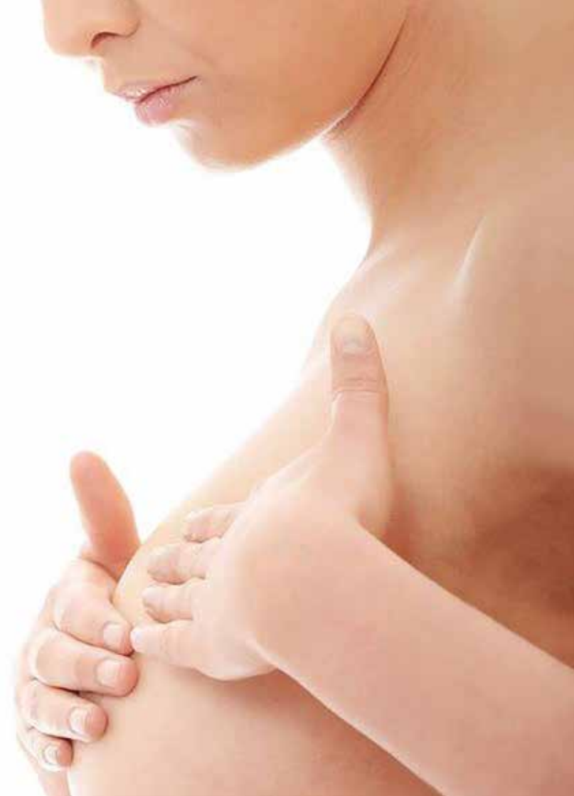
Nach der Pigmentierung